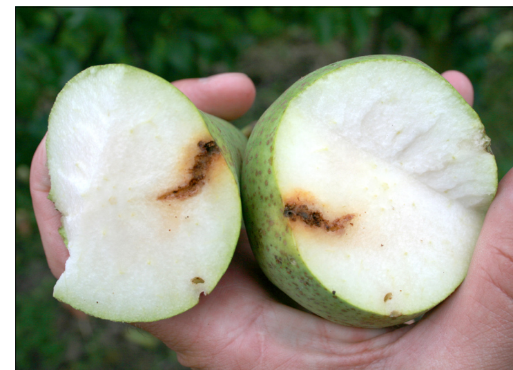
Door fruitmot aangetaste Conference-peer

Pcfruit deed ook onderzoek naar de effecten van plantversterkers op perenschurft. In het natte jaar 2024 werd gekeken in hoeverre de middelen Vacciplant en Charge