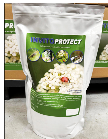
Invito Protect is speciaal ontwikkeld om nuttigen naar de boomgaard te lokken