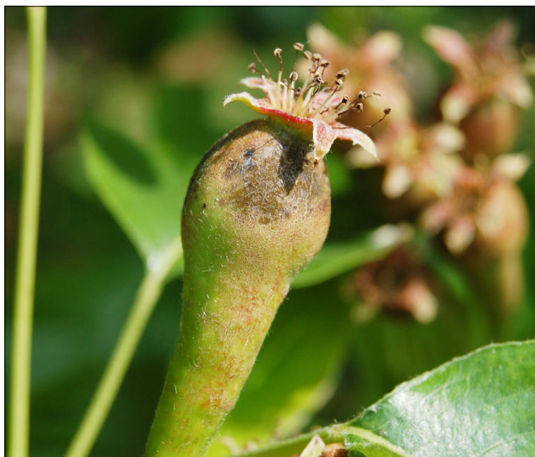
Schurft op jonge perenvrucht

en de CM4K-dop. De Combo-dop bevat het feromoon codlemone en een plantenlokstof (kaiomoon), in de vorm van een peerester, die zowel mannetjes als vrouwtjes aantrekt. CM4K is een nieuwe dop die drie plantenlokstoffen bevat en die gecombineerd wordt met een aparte dispenser met azijnzuur. In mei en juni waren er slechts kleine verschillen in fruitmotvangsten tussen beide doppen. Vanaf eind juni (in aanwezigheid van meer concurrerende geurstoffen van rijpend fruit) was de CM4K-lokstof echter duidelijk beter in staat om fruitmotten naar de val te lokken dan de Combo-dop.