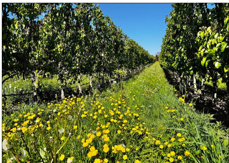
Dit jaar hebben veel perentelers lang gewacht met het maaien van de grasstroken tussen de perenbomen zodat bloeiende planten nuttigen konden lokken.