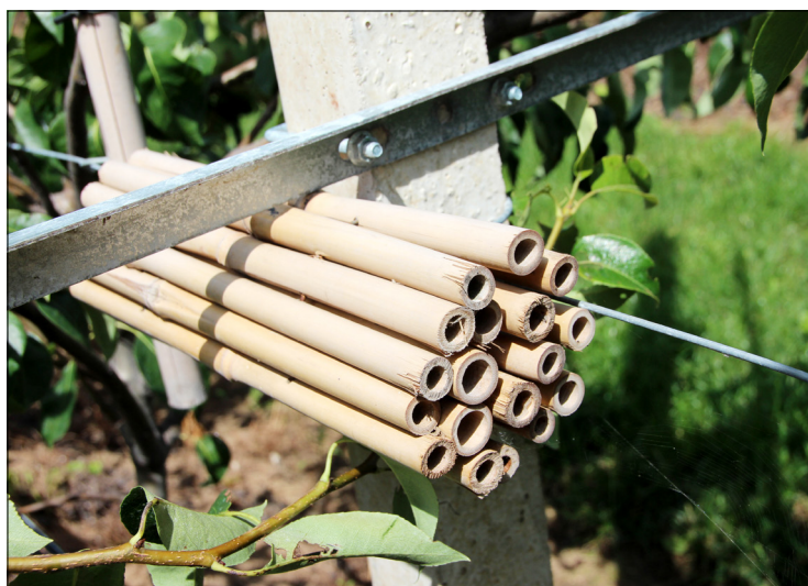
Predasect-huisjes bieden in de zomermaanden een schuilplek aan nuttige insecten en functioneren in de winter als overwinteringsplaats.