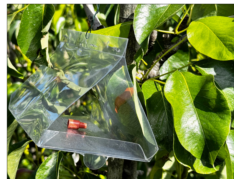
Nauwkeurig monitoren van fruitmot is essentieel voor een goede fruitmotbestrijding