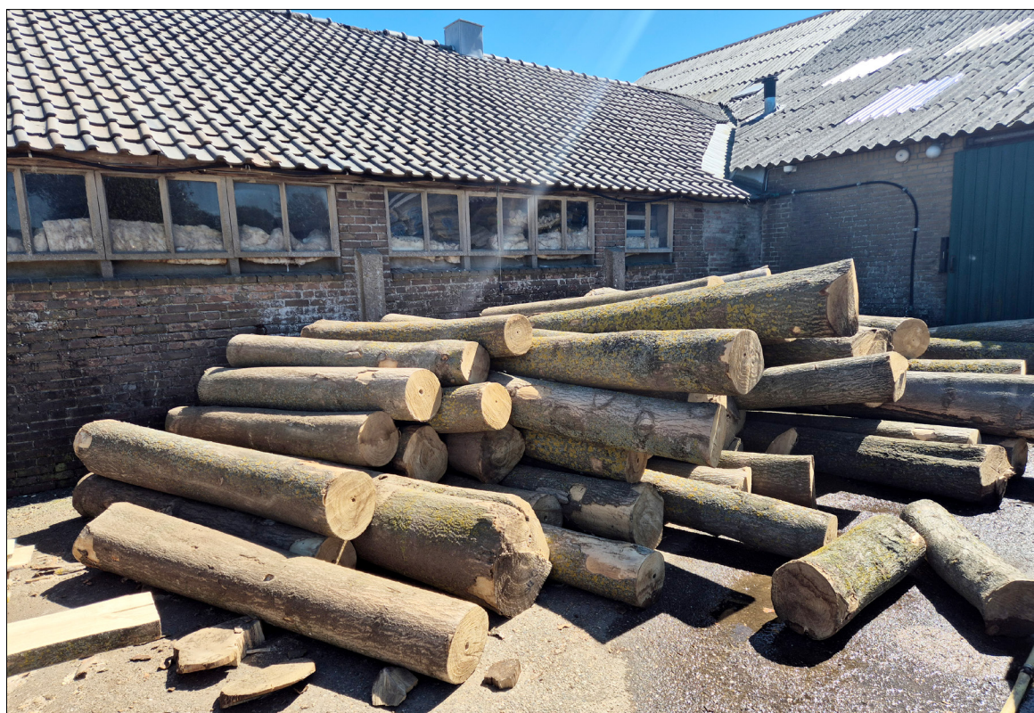
Paulownia-bomen groeien erg snel en geven al na 10 jaar kaprijpe bomen. Er wordt geëxperimenteerd met intensievere planten en al veel eerder oogsten voor de productie van vezelplaten. WTE fruitadvies