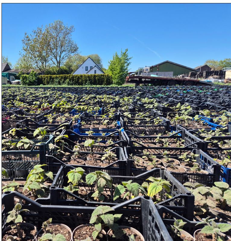
Plantmateriaal van Paulownia wordt door Paulownia Cultures als wortelstek in potten opgevoerd. WTE fruitadvies

insertlogo:stapelbed.com Wil je direct de juiste keuzes maken? Bezoek stapelbed.com tijdens de Perendag op 25 juni. stapelbed.com levert betrouwbare, snel op te bouwen slaopplossingen voor o.a. evenementen, hostels, opvanglocaties en seizoenswerkers. +31 (0)71-5230184 | info@stapelbed.com