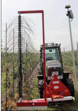
Darwin-dunmachine voorzien van een camera om de dunning per boom af te stemmen op de bloei.

De SmaArt-techniek maakt het mogelijk om iedere boom afzonderlijk op de meest optimale manier met de machine te dunnen. SmaArt bestaat uit een camera, een razendsnelle computer en de bekende Darwin-dunmachine. De camera maakt opnames van de bomen en registreert hierbij hoe intensief iedere boom bloeit. De computer berekent vervolgens wat de optimale rotatiesnelheid van de spindel van de dunmachine is voor die specifieke boom. SmaArt is bedoeld om percelen met een onregelmatige bloei beter te kunnen dunnen en om de dunning minder afhankelijk te maken van de ervaring van de bestuurder.