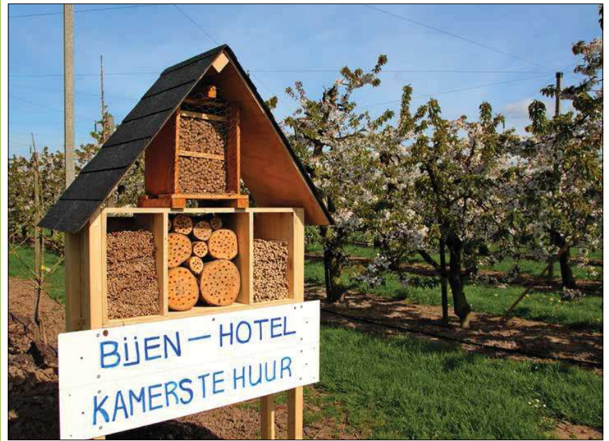
Bijenhôtel met nestgelegenheden voor metselbijen

Door een aangepaste verzorging van de bijenhôtels is de populatie schadelijke parasieten op een laag niveau te houden en de het aantal overlevende metselbijen